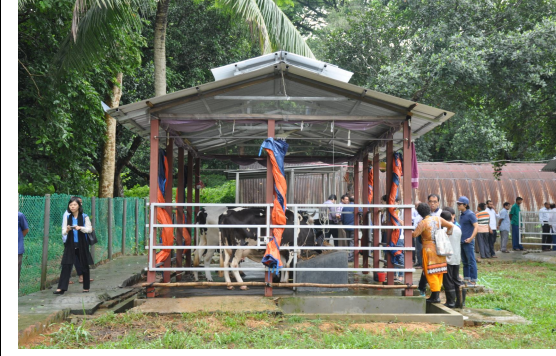
বার্ড প্রদর্শনী দুগ্ধ খামার উদ্বোধনের দিন Koica Bangladesh এর প্রতিনিধি ও বার্ডের কর্মকর্তাবৃন্দ