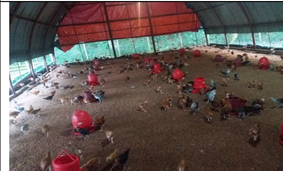
বার্ড প্রদর্শনী পোল্ট্রি খামার