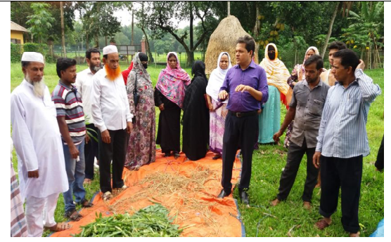
প্রশিক্ষণার্থীদের হাতে কলমে সাইলেজ তৈরি বিষয়ক প্রশিক্ষণ দেয়া হচ্ছে।