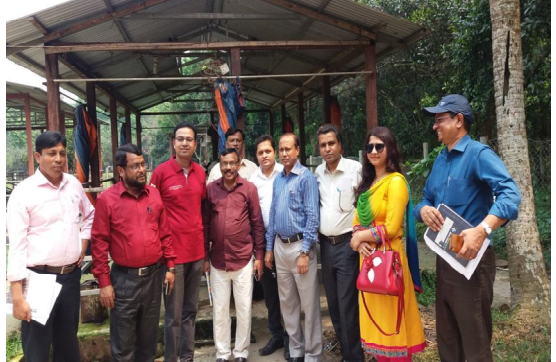
শেরে বাংলা কৃষি বিশ্ববিদ্যালয়ের শিক্ষকবৃন্দের বার্ড প্রদর্শনী দুগ্ধ খামার পরিদর্শন