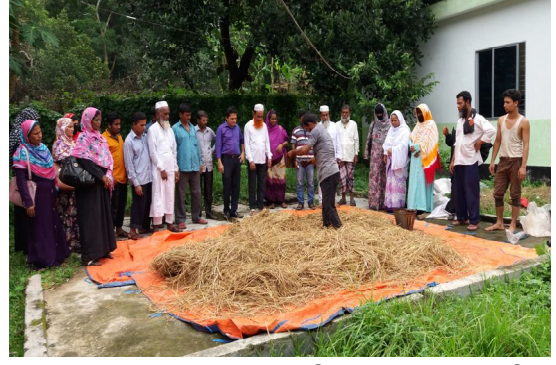
প্রশিক্ষণার্থীদের হাতে কলমে ইউরিয়া মোলাসেস স্ট্র তৈরি বিষয়ক প্রশিক্ষণ দেয়া হচ্ছে।