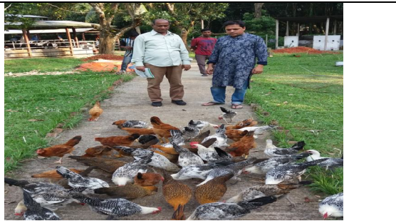
চট্টগ্রাম ভেটেরিনারি ও এনিম্যাল সাইন্সেস বিশ্ববিদ্যালয়ের প্রফেসর এর বার্ড প্রদর্শনী পোল্ট্রি খামার পরিদর্শন