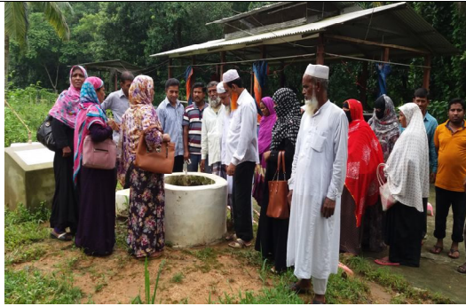
বায়োগ্যাস প্লান্ট পরিদর্শনকালে প্রশিক্ষণার্থীগণ