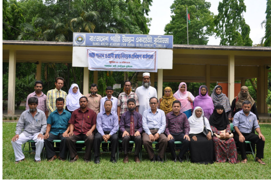
গাভী পালন ও প্রাণি স্বাস্থ্য বিষয়ক প্রশিক্ষণ কোর্সের প্রশিক্ষণার্থী ও বার্ডের অনুযদবৃন্দ।